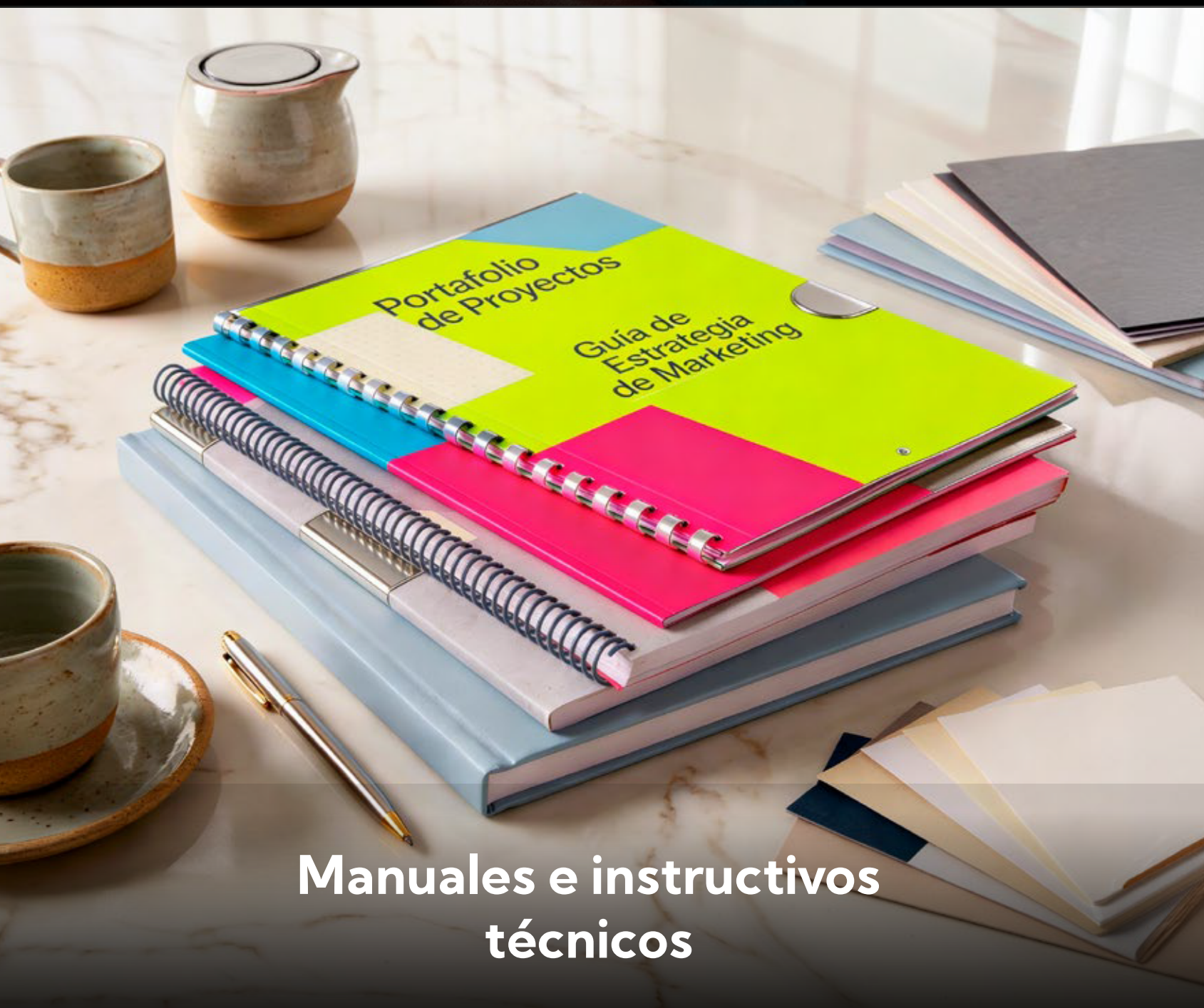
Manuales e instructivos técnicos