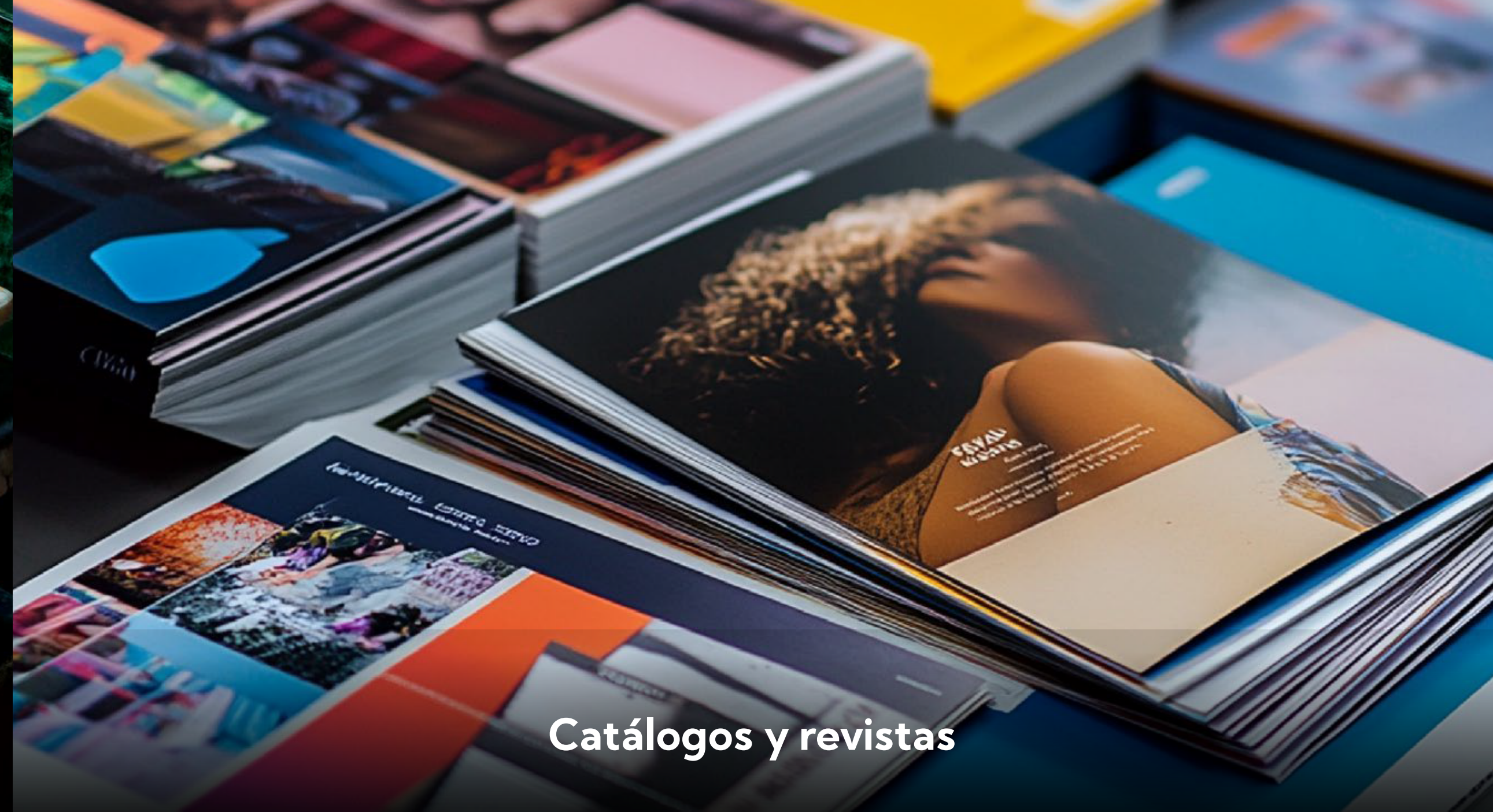
Catálogos y revistas