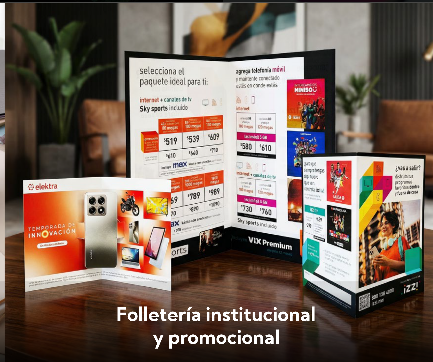
Folletería institucional y promocional