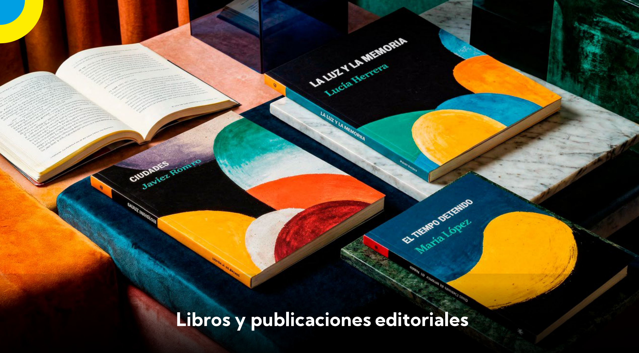
Libros y publicaciones editoriales