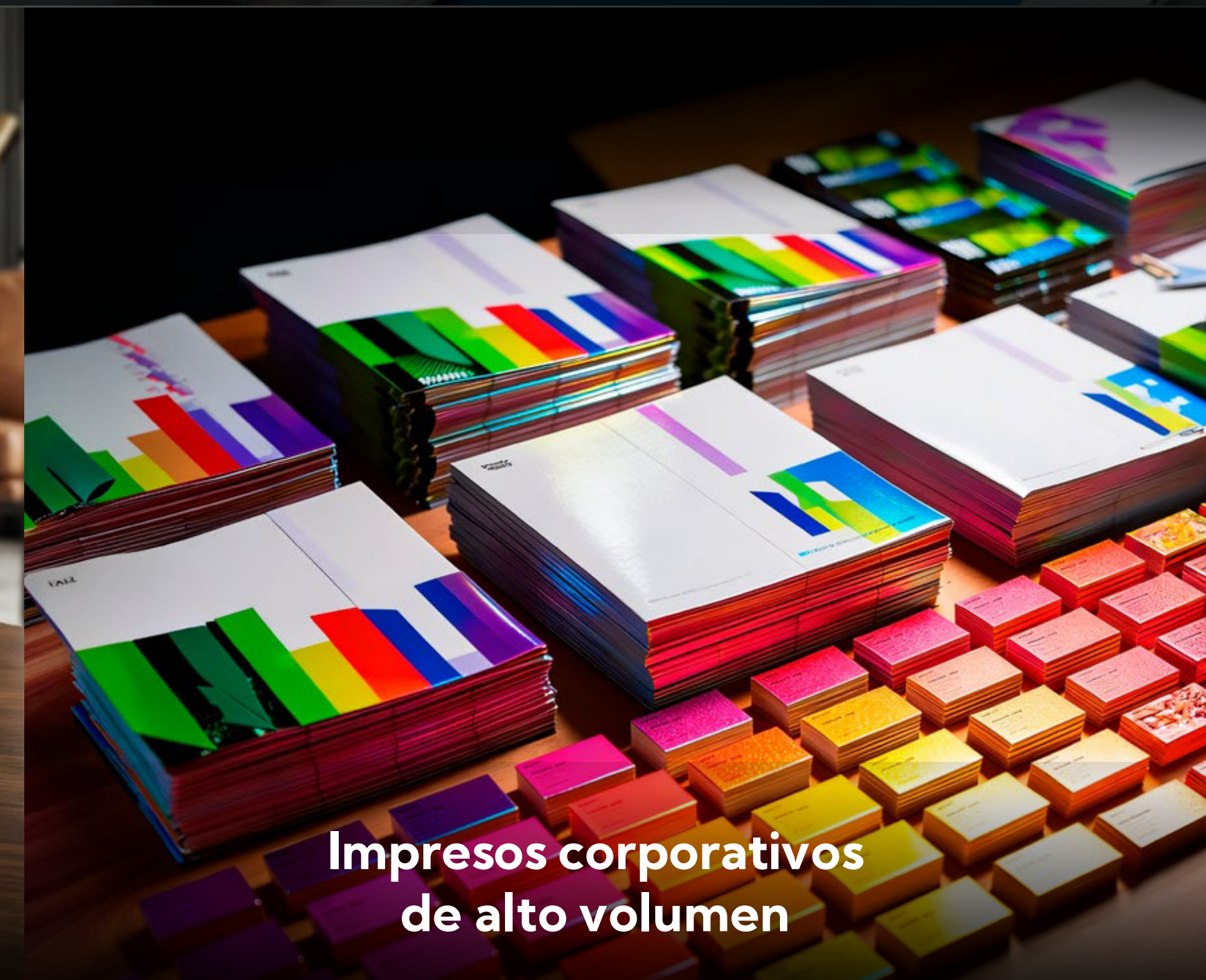
Impresos corporativos de alto volumen